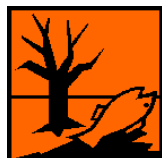
Dangereux pour l'environnement